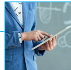
Beste Ausstattung für unsere Schulen!