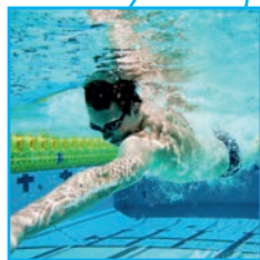
Bäder erhalten und fördern!