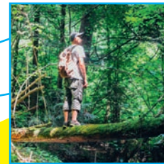
Tourismus in Brilon und Dörfern stärken!