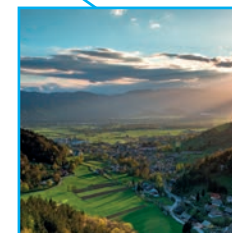
Dorfkultur weiter voranbringen!