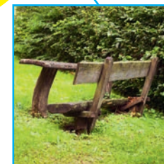
Digitalisierung – Mängel online melden!