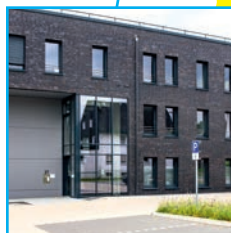
Transparenz in städtischen Tochtergesellschaften