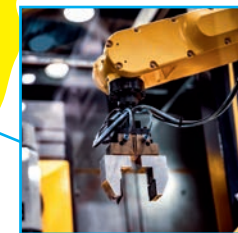
Gute Rahmenbedingungen für die heimische Wirtschaft schaffen!